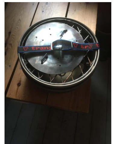
RitniGrid® -muunnin pakattuna